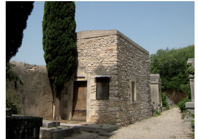
Chapelle du Désert.

Bien sûr, l'organisation des pompes funèbres et l'impression des faire-part réclament des délais très rapides, mais la diversité des activités assurées par les officiants ainsi que l'organisation matérielle de l'ouverture d'une concession exigent une entente préalable.